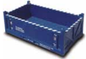
3m Open Top